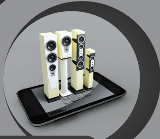
“奇迹”不只可以出现在纸质媒介上