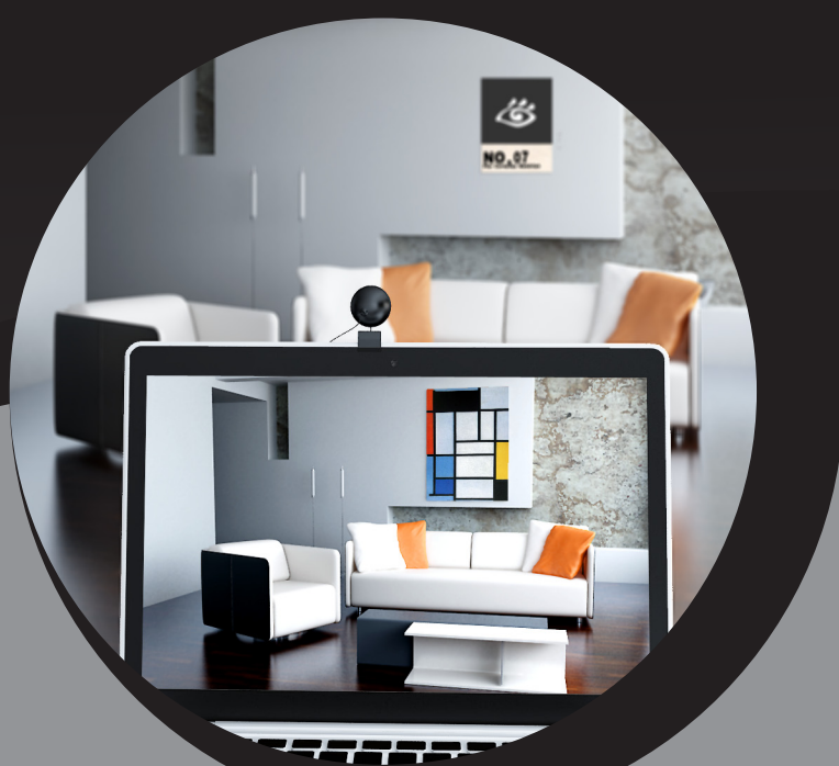
随时随地在真实环境下预览产品摆放效果