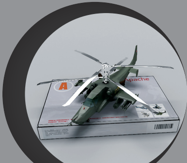
预览模型玩具组装后的效果