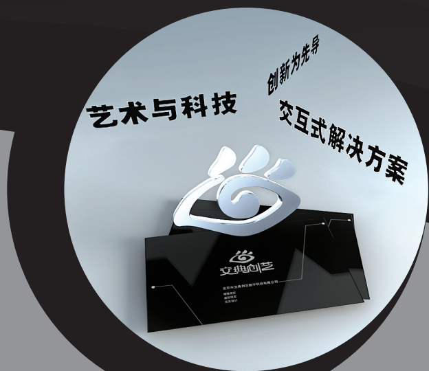
小名片大内涵，脱颖而出易如反掌